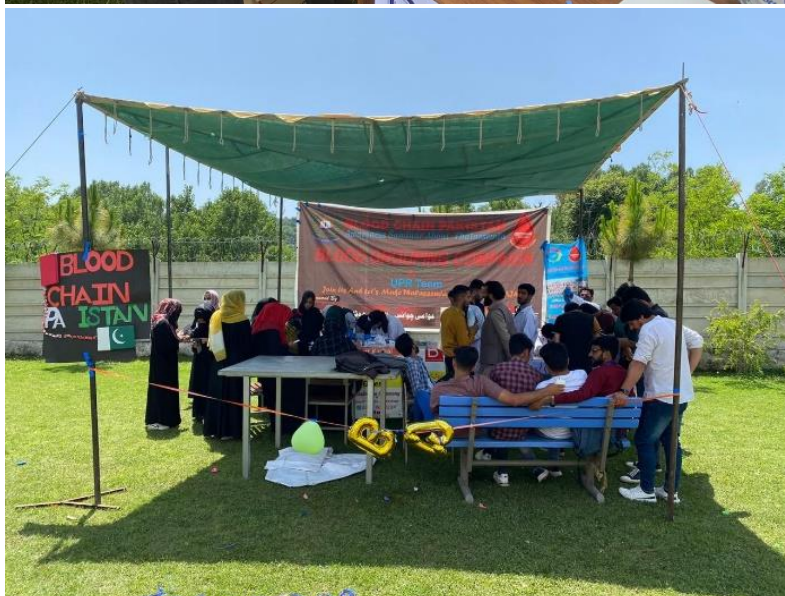
Students working in blood grouping campaign at UPR