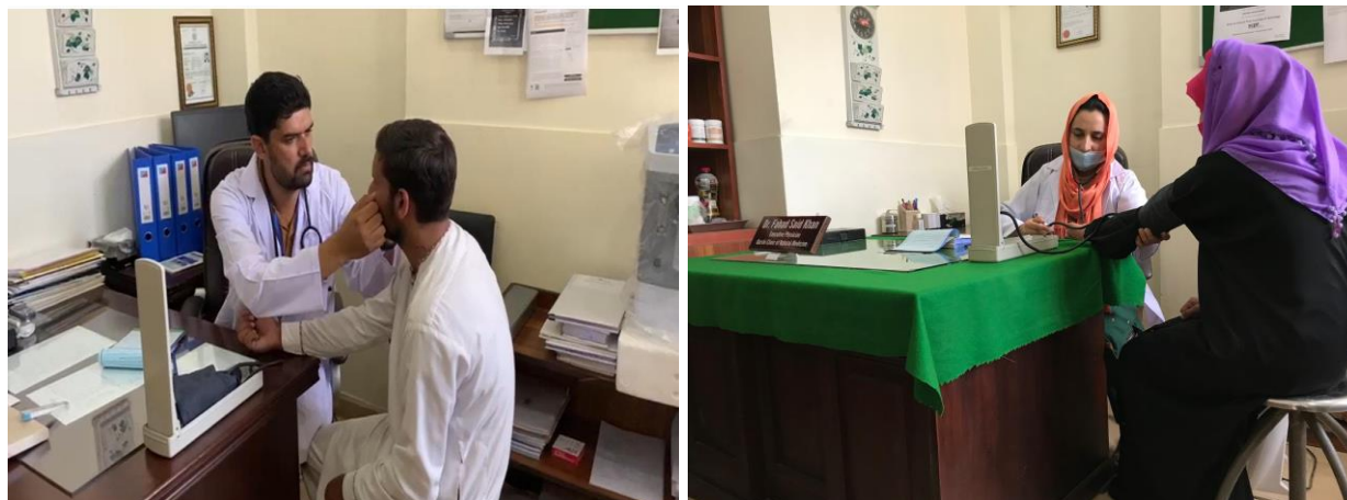
A Glimpse into Patient Checkups at the University Health Center