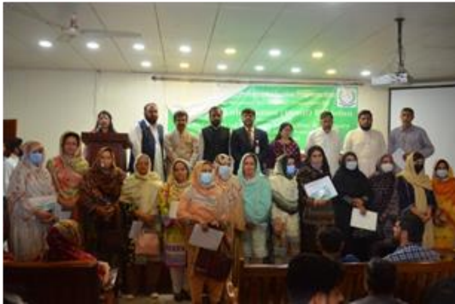
One Day Seminar on “Physis with Continuing Tibbi Professional Education Program” May 31, 2022 National Seminar organized by Department of Eastern Medicine, Faculty of Medical and Health Sciences, University of Poonch Rawalakot, Pakistan