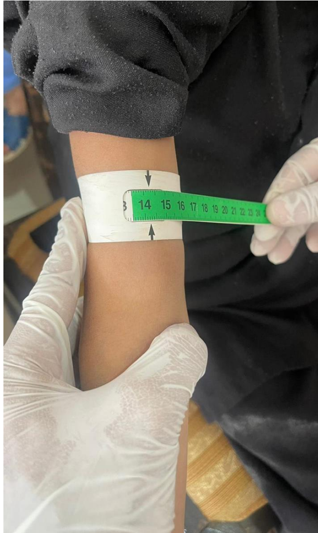
Taking MUAC of Child at SOS village.