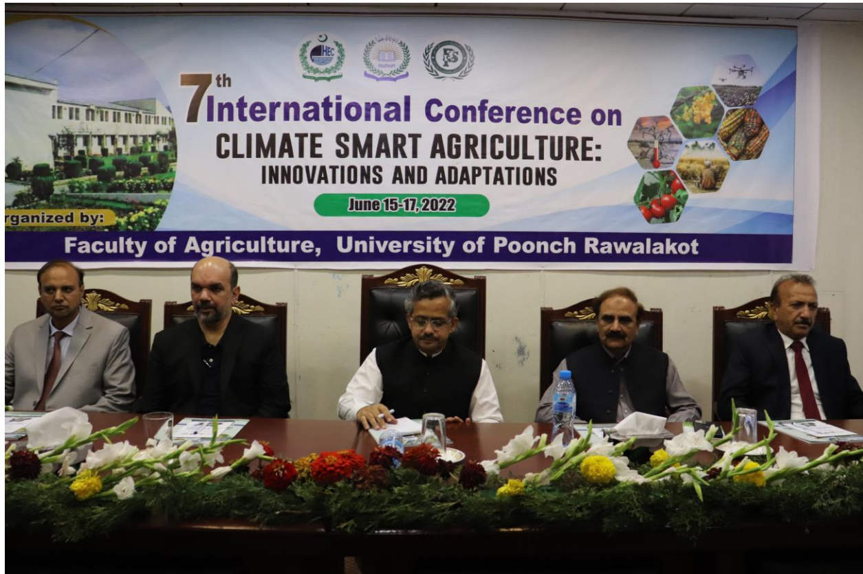
Closing ceremony of 7 th International conference of UPR