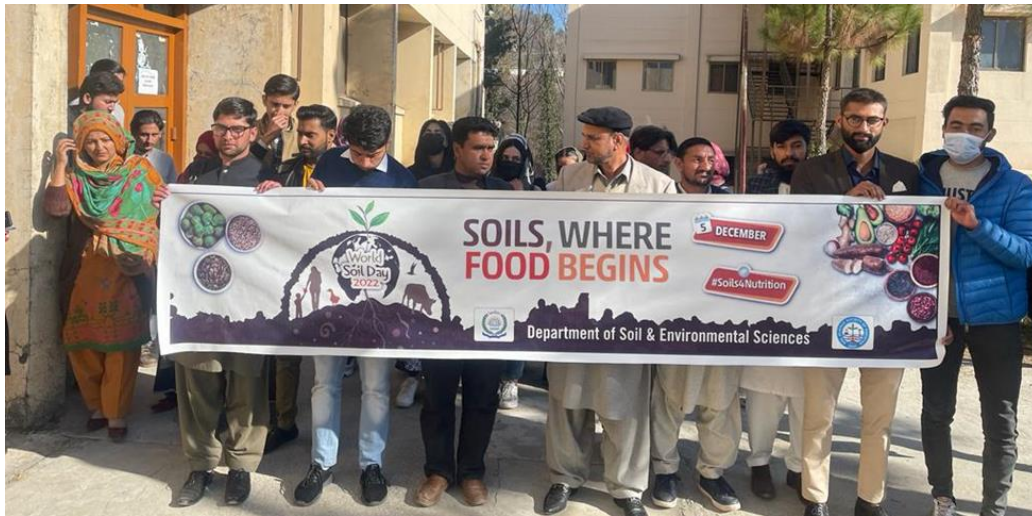
Walk on world Soil Day

On Soil Day, UPR hosted a seminar with the theme "Soil where food begins" to inform people about the value of healthy soil and its role in producing food. The lecture focused on the idea that soil health is vital to both human and environmental health, emphasizing the one health concept of the entire environment. This program contributes to the growing awareness of the interdependence of the environment and the soil and the importance of each for the other's health.