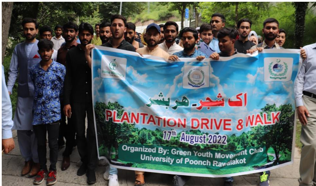
Plantation Drive and Walk on 17 August 2022