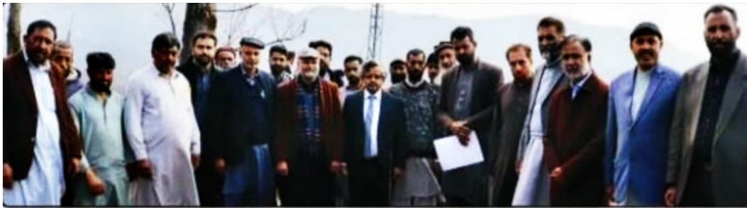
راولاکوٹ، وائس چانسلر جامعہ پونچھ ڈاکٹر ذکریا ذاکر کا ایگریکلچر فارم کے تحت آرچرڈ کے افتتاح کے بعد فیملی ممبران اور دیگر عملے کے ہمراہ گروپ فوٹو

بقیہ 6 ہم، یعنی ممبران اور دیگر بھی بڑی تعداد میں موجود تھے اس موقع پر فارم غیر ممبران نے ایگریکلچر فارم کے تحت لگائے جانے والے بے باغ سے حلقہ بریکنگ دی گئی انہوں نے کہا کہ آرچرڈ میں حلقہ ہار کے پھلدار پودے لگائے جارہے ہیں جو جامعہ پونچھ اور ایگریکلچر فارم سمیت کے دو طرفہ تعاون سے تیار کئے گئے ہیں۔ جو اعلیٰ کوٹائی کے ہیں اس موقع پر وائس چانسلر نے زراعت کے حلقہ شعبوں میں فیملی آف ایگریکلچر کے کردار کو سراہا۔