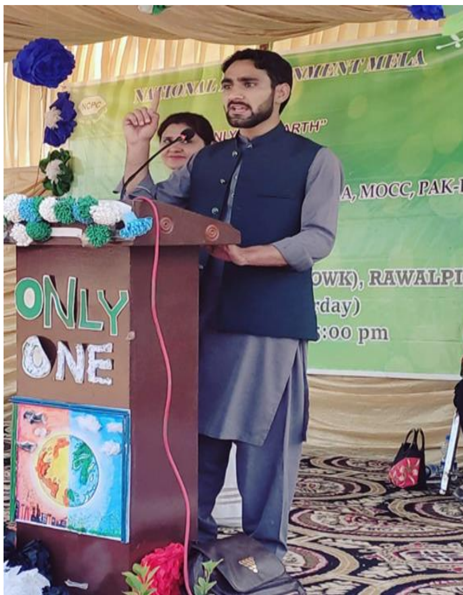
Participating in the 2022 National Environment Debate Competition with the Theme, "Only One Earth" at Ayub National Park, Rawalpindi, on March 19, 2022