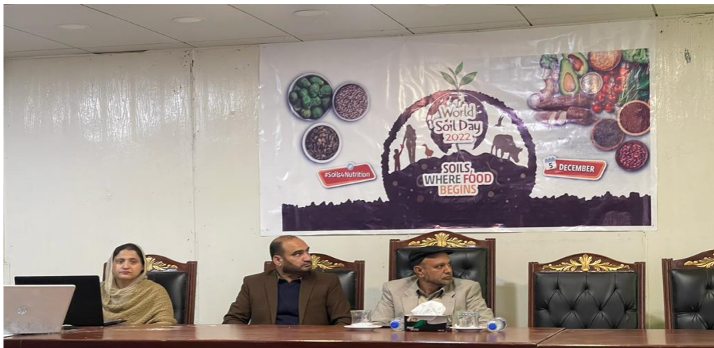
Soil Day December 5, 2022