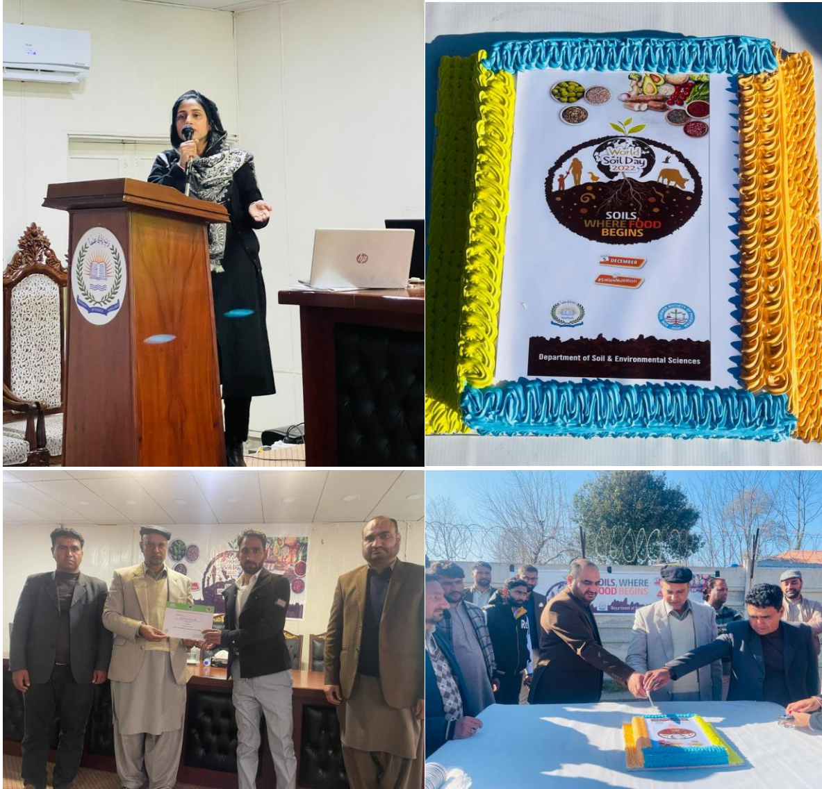
Highlights from the World Soil Day 2022 celebrations at UPR